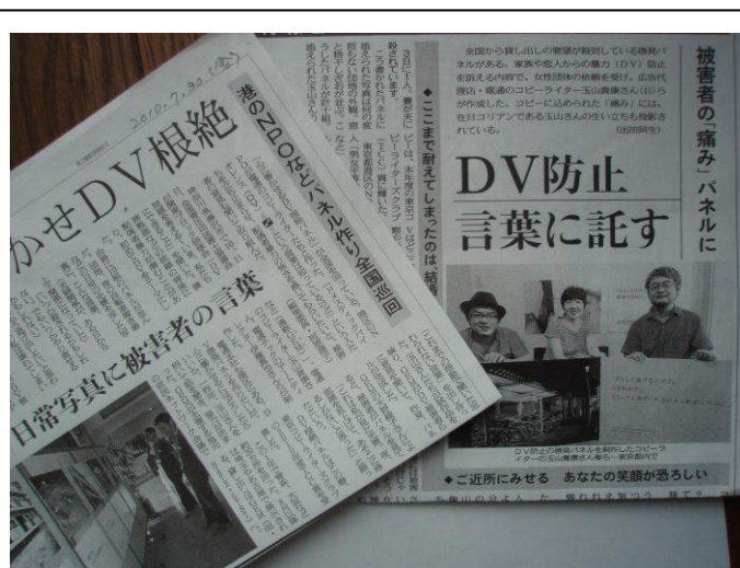
朝日新聞東京版（7.30）、東京新聞「こちら特報」（8.15）に掲載され、多くの人にお知らせすることができました。

京都、大津、都内港区、世田谷区、ウイメンズプラザなどに展示、ご覧になった方々から熱いメッセージをいただきました。今後の展示日程は右の通りです。ぜひ一度、最寄りの会場にお越し下さい。