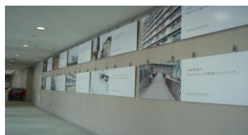
09年10月ウイメンズプラザ

DV根絶の第一歩は、多くの方がDVを「他人事ではない」と感じる事。その思いを込めて制作したパネルが、昨年7月の発表会（女性と仕事の未来館）以来、全国各地の男女共同参画センターや市民団体に展示活用されています。昨年は、青森、大阪、富山、横浜、仙台、