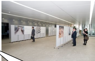
字てがみセラピー作品

DV 防止ネットワークをつくり DV 根絶パネルの展示会など啓発活動を全国に広げています。